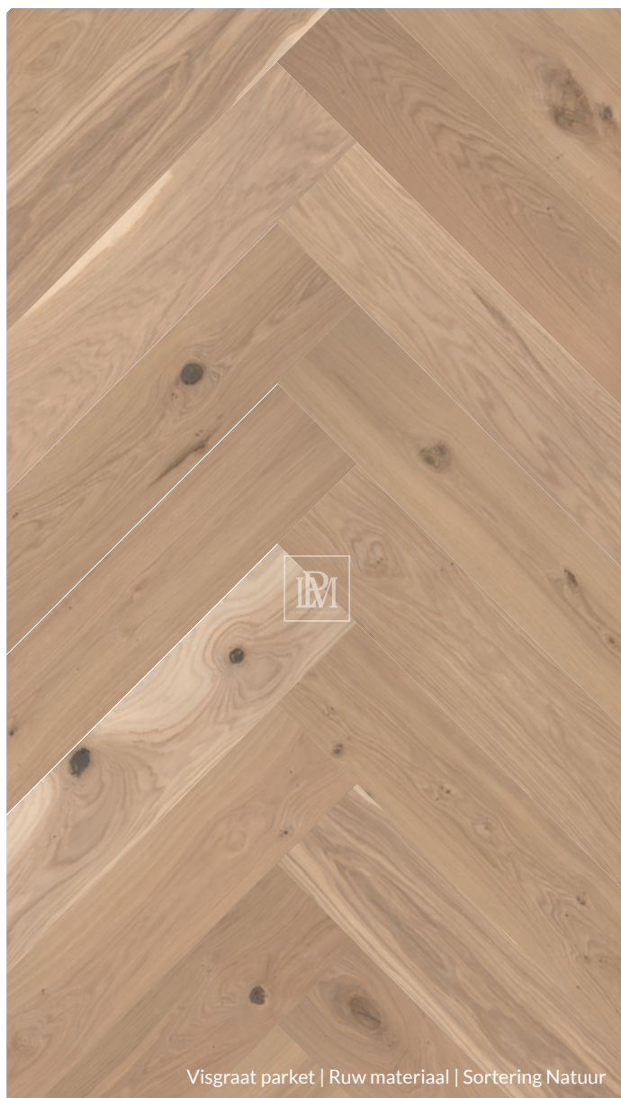
Visgraat parket | Ruw materiaal | Sortering Natuur